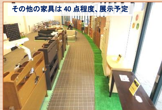
※写真はすべて過去のものです

毎月、家具と自転車の抽選販売を行っています。(自転車は10月まで) 1日から15日までの間、展示品の抽選申込を受付いたします。 5月は遊具とベビーカーを10点程度展示します。