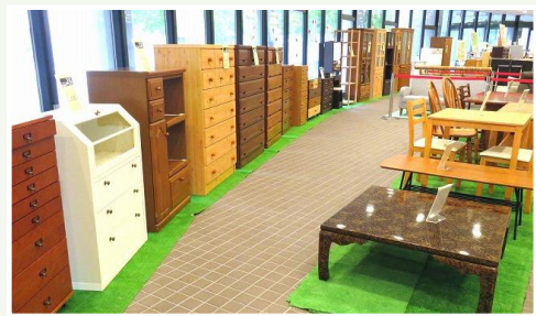
写真は過去のものです

抽選日 12/16(火)10 時～ お申込みのなかった家具は、抽選後の 14 時から 即売になります。12/21 日(日)まで。