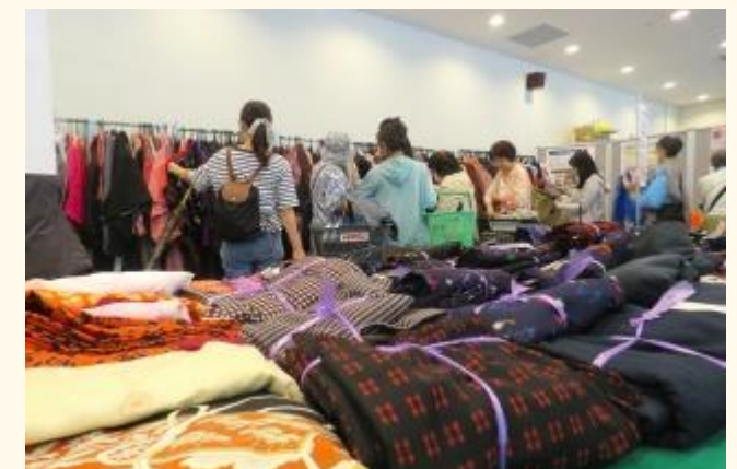
写真は過去の開催時の様子。会場が混雑した場合、入場制限をさせていただく場合があります