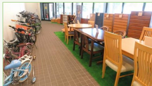
写真は過去のものです

抽選日 5/16(金)10時~ お申込みのなかった家具は、抽選後の14時から即売になります。5/22日(木)まで。