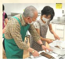
教室講師、アシスタント