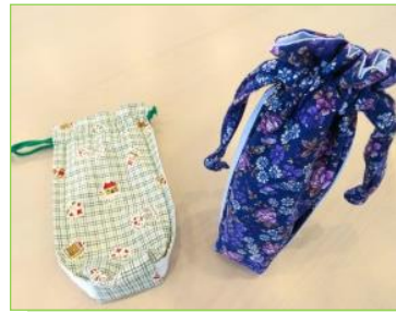
作品例。右はペットボトルを入れた状態