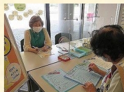
イベントのサポート