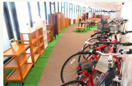
写真は過去のものです