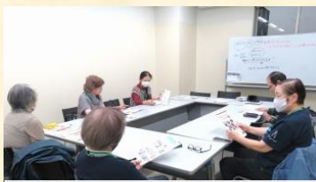
ボランティア会議、情報誌編集

リサイクルプラザ宮の沢の活動をお手伝いしてくれる方を募集しています。「特別、得意なこともないけど…」という方も、興味・関心がある18歳以上の方ならOK! 「イベントの受付や簡単な作業なら手伝える」という方、「布ぞうりや包丁研ぎ、手芸系教室の講師をしてみたい」という方は特に大歓迎です。スキルアップ研修もあります。